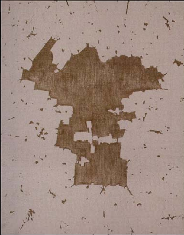
Memoria del geto IV. 2006. 146x144 cm. Gesso sobre arpillera.