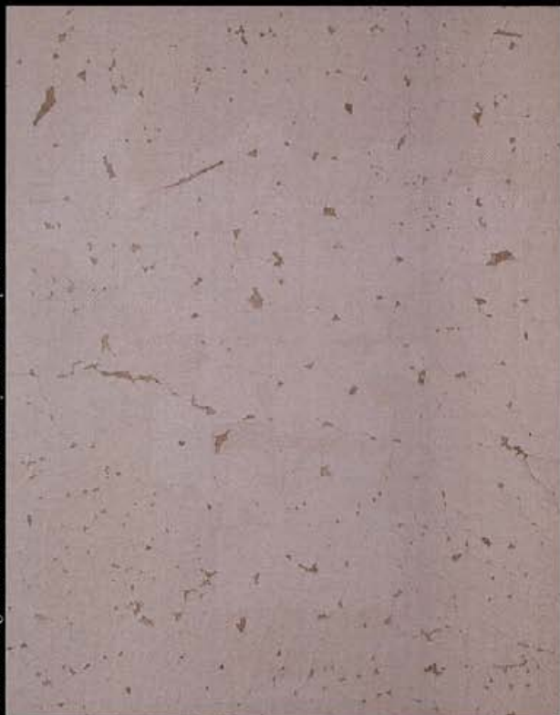
Memòria del gero I. 2006. 146x144 cm. Gesso y cola sobre apillera.

horror, una cartografía de su memoria: planos, mapas, fotos aéreas y arquitecturas del desastre, que conformarán las series de una estrategia visual de aproximación, para localizar los escenarios del crimen, para situar con la máxima precisión los lugares de su memoria.