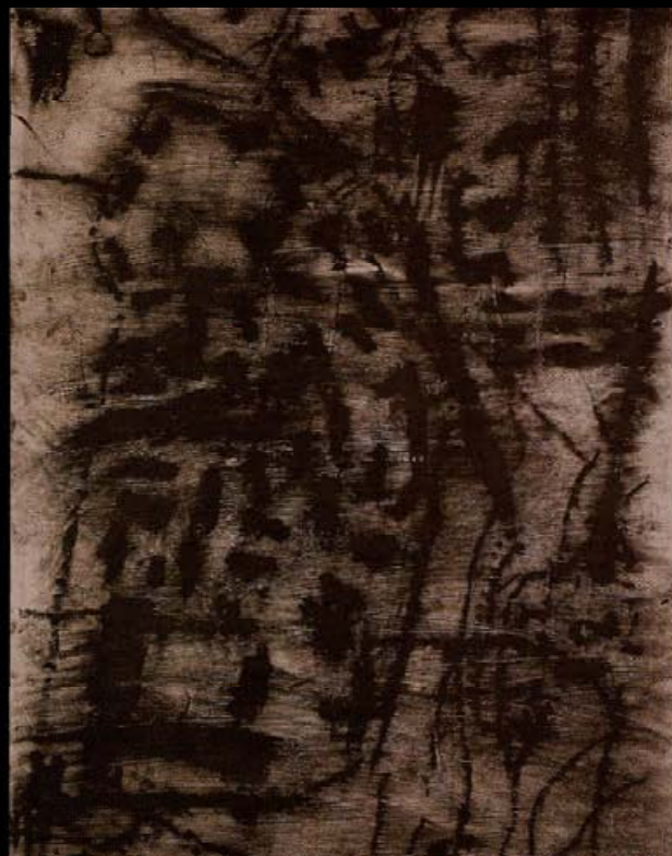
L'esborrament d'Ebenisee II. 2005. 116x89 cm. Técnica mixta sobre madera.