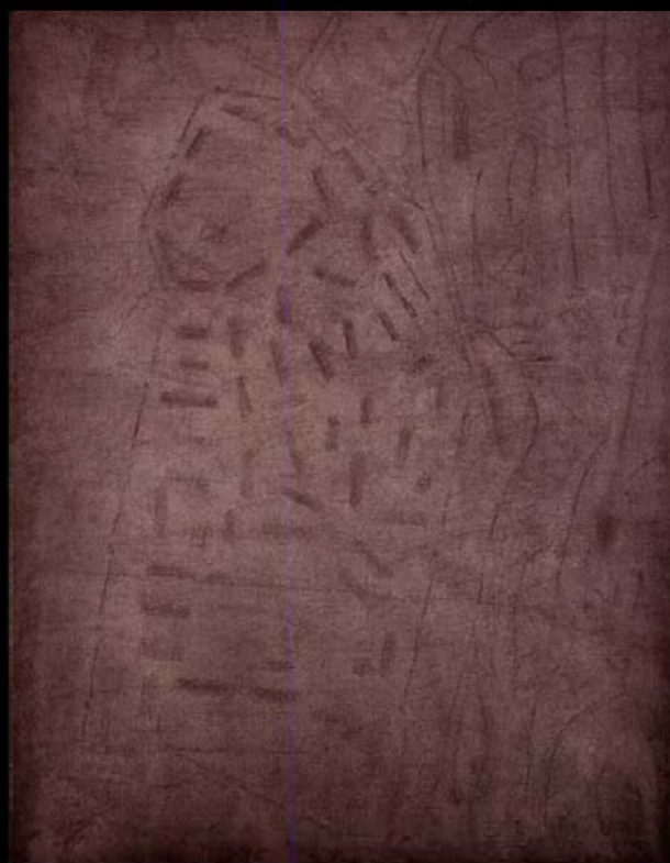
L'esborrament d'Ebensee IV. 2005. 116x89 cm. Técnica mixta sobre madera.

“ Tuve ocasión de viajar a Mauthausen en el 60 aniversario de su liberación, y recorrer a pie los escenarios del crimen: el descenso a la cantera, a la cámara de gas, y al crematorio, me dieron acceso a un conocimiento más preciso del lugar donde ocurrieron los hechos. Sin embargo, lo que más me impresionó fue precisamente lo que no podía ver: los campos anexos de Gusen y Ebensee , no solo fueron borrados del mapa, sino que