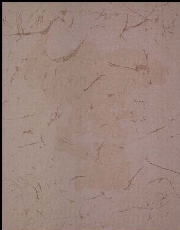
Memòria del gero II. 2006. 146x144 cm. Gesso y cola sobre apillera.

¿Cómo desarrollar una mirada ética? Es la pregunta que guía mi trabajo desde entonces hacia la apertura al dolor del otro, en la escucha de su rela-