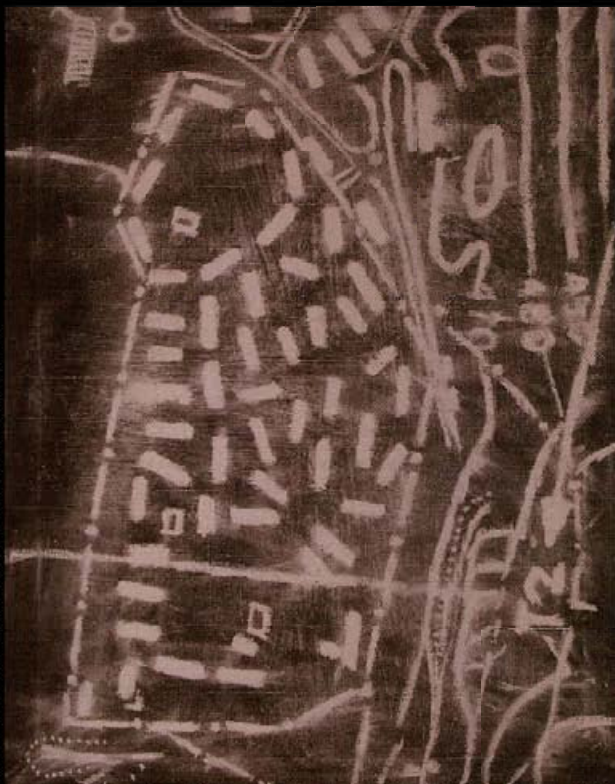
L'esborrament d'Ebenisee I. 2005. 116x89 cm. Óleo sobre lino.